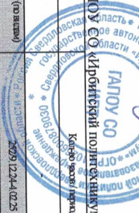
График учебной и производственной практики по образовательным программам, реализуемым в 2024-2025г.г. в ГАПОУ СО «ИИТ»